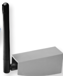
antena 434MHz - opcja